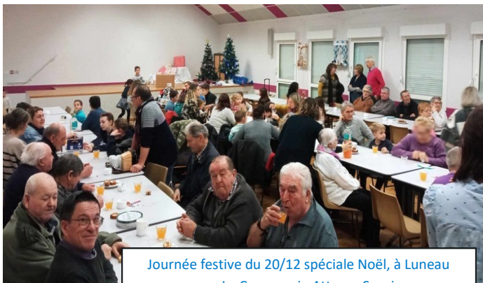
Journée festive du 20/12 spéciale Noël, à Luneau avec La Compagnie Attrape Sourire