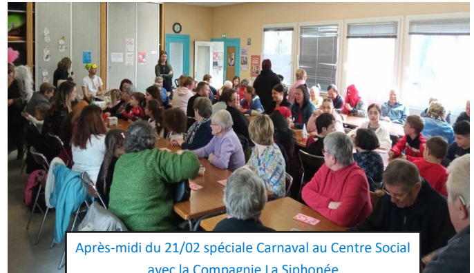
Après-midi du 21/02 spéciale Carnaval au Centre Social avec la Compagnie La Siphonnée

Les journées et après-midis festives intergénérationnelles que propose le Centre Social sont toujours les bienvenues et d'autant plus attendues : enfants, familles, séniors sont conviés à participer à des moments de partage, d'échanges, de convivialité... Rythmées de jeux, de divers spectacles, de bons goûters, et bien d'autres choses... ces journées plaisent et sont maintenant réclamées ! En plus d'être itinérantes sur les différentes communes du territoire, elles sont accessibles à toutes et tous grâce au transport minibus mis en place.