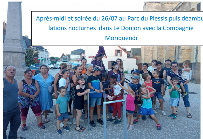
Après-midi et soirée du 26/07 au Parc du Plessis puis déambulations nocturnes dans Le Donjon avec la Compagnie Moriquendi